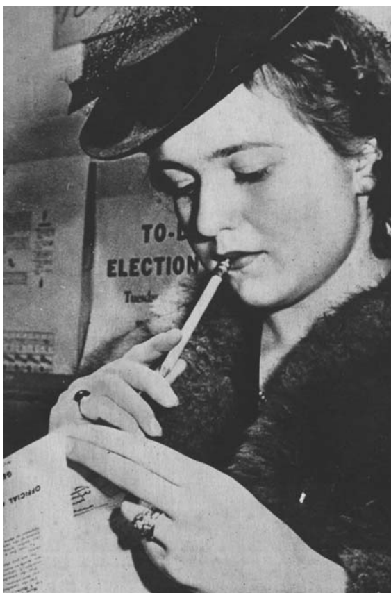
Una signora americana studia la scheda prima di votare. Non è la prima volta. Roosevelt è stato rieletto anche col suo voto. La riforma della costituzione dipende tra l'altro dalle meditazioni di una donna.

«The right of citizens of the United States to vote shall not be defined or abridged by the United States or by any State on account of sex. Congress shall have the power to enforce this article by appropriate legislation».