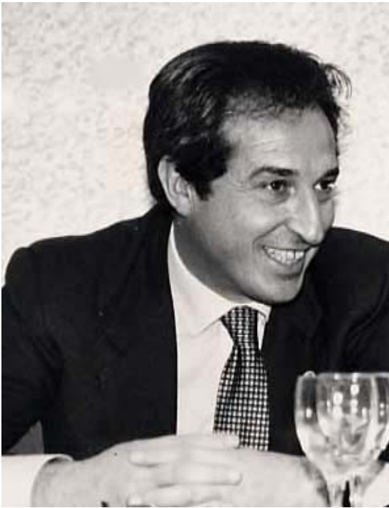
Sergio D'Antoni (1989-1991)