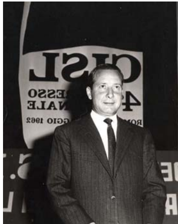
Bruno Storti (1958-1976)