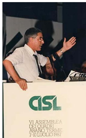
Franco Marini (1985-1991)