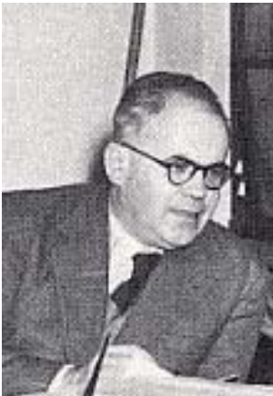
Giulio Pastore ( 1950-1958 )